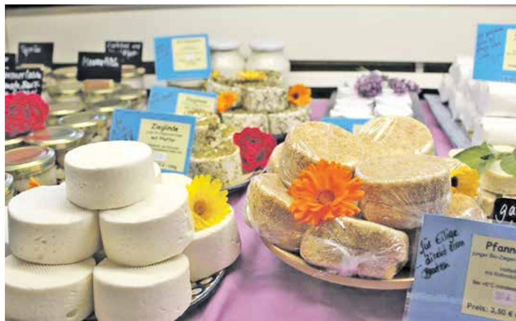
Ziegenkäse-Spezialitäten aus der ökologischen Landwirtschaft des Ziegenhof Lauterbachs.

Seine Leidenschaft für nachhaltige Hotellerie bringt der Direktor aus dem Erzgebirge mit, wo er 27 Jahre lang ein eigenes Haus führte. Daher bewegt ihn auch die Zukunft seines Gewerbes: „Nachhaltigkeit wird uns einen Wettbewerbsvorteil bringen“.