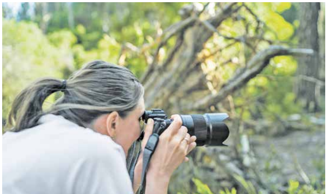
Besondere Momente für immer festhalten: Die Kamera gehört für viele zur unverzichtbaren Reise-Ausstattung.

einer breiten Aufnahme zusammen. Das ist besonders toll für weite Landschaften oder hohe Gebäude.“ Um die XXL-Fotos richtig zu Geltung zu bringen, eignet sich beispielsweise ein Cewe Fotobuch mit Panoramaseite. (Quelle: djd)