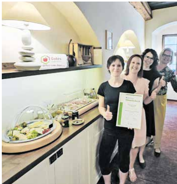
Das Team der Pension Donatus freut sich über den erfolgreichen DEHOGA Umweltcheck.

Ab Februar beginnt die Produktion: Schnittkäse, Weichkäse und Frischkäse mit oder ohne Kräuter. Auch Ziegenwurst ist im Angebot. Etwa ein Viertel der erzeugten Produkte geht über die Theke des eigenen Hofladens. Den Rest liefert der Hof an mehr als 50 Wiederverkäufer und Gastronomen in der Region: Bioläden, Regionalläden, Cafés, Restaurants, Pensionen und Hotels.