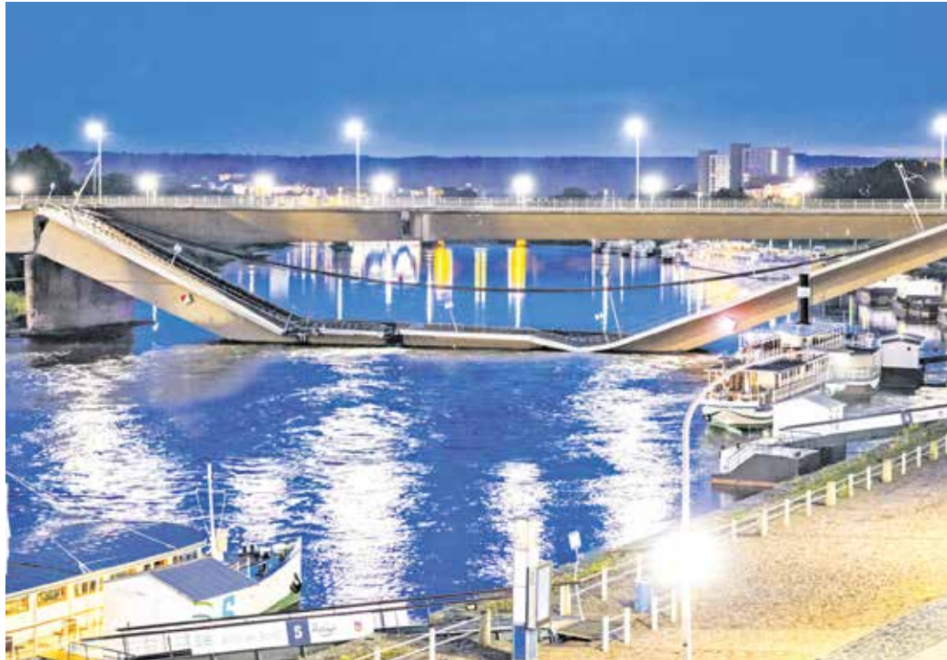
In der Nacht zum 11. September 2024 ist der elbabwärts liegende Zug der Carolabrücke eingestürzt. Das ist eine der ersten Aufnahmen knapp drei Stunden nach dem dramatischen Ereignis. Im Buch „Der Brückeneinsturz“ werden die dramatischen Ereignisse und ihre Konsequenzen, die lange Geschichte dieses Bauwerks und auch der anderen Dresdner Elbebrücken und ihr Zustand dargestellt.