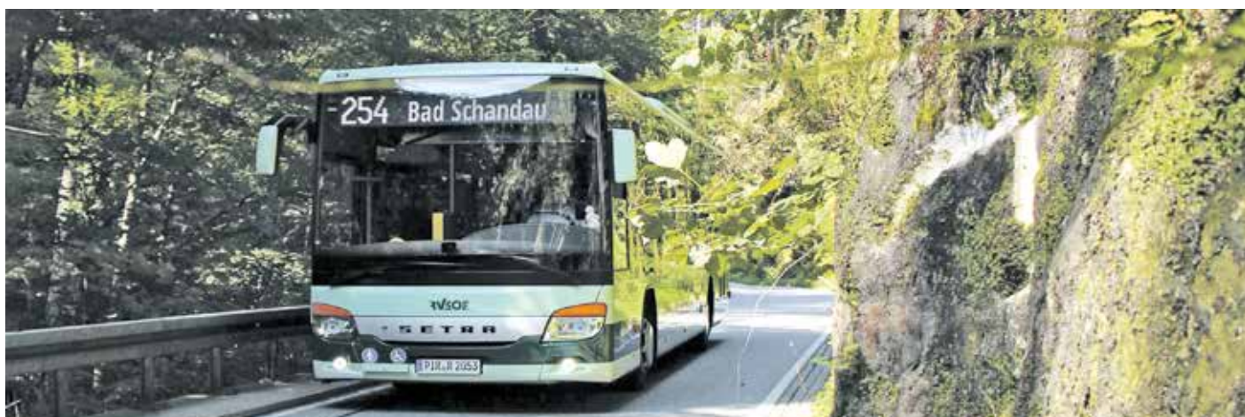
Redaktion: Solveig Großer, Regionalverkehr Sächsische Schweiz-Osterzgebirge GmbH

meisten Fahrten in Cunnersdorf miteinander verknüpft sein werden. Zudem soll auf beiden Linien ein Stundentakt angeboten werden.